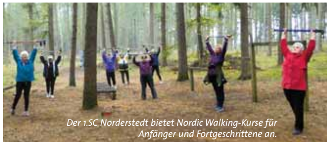
Der 1.SC Norderstedt bietet Nordic Walking-Kurse für Anfänger und Fortgeschrittene an.

Gelebte Integration ist keine Frage des Alters, sondern bedeutet gemeinsam bewegt und aktiv zu sein. Daher unterstützt der Landessportverband Schleswig-Holstein (LSV) die bundesweite Maßnahme des Deutschen Olympischen Sportbundes „Zugewandert und Geblieben“. Der LSV konnte mit seiner Bewerbung in der Ausschreibung des DOSB mit seinen 98