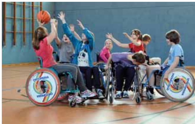
Im Projekt „Rollstuhlsport macht Schule“ lernen die Schülerinnen und Schüler den Rollstuhl als Sportgerät kennen.

Unter dem DRS-Motto „Gemeinsam was ins Rollen bringen“ fördert die UK Nord, deren Augenmerk auf der Sicherheit und Gesundheit in Schulen liegt, das Projekt tatkräftig: „Im Projekt